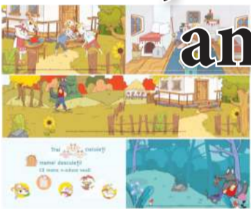
CAPRA CU TREI IEZI

Eroii poveștilor lui Ion Creangă au prins o nouă „viață”, una digitală, în format 2D. Studioul de producție animată „Kreyon” a obținut sprijin financiar de la Uniunea Europeană pentru realizarea proiectului „Poveștile lui Ion Creangă în 2D”. Mai nou, fata babei și fata moșneagului, soacra cu trei nurori, dar și eroii altor povești, le vorbesc picilor nu numai în limba română, dar și în rusă, și chiar engleză. Proiectul a fost realizat cu sprijinul financiar al Uniunii Europene, în cadrul programului UE „Măsuri de Promovare a Încrederii”, implementat de PNUD.